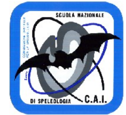
SCUOLA NAZIONALE DI SPELEOLOGIA